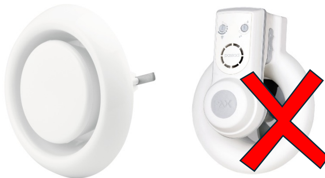
Figur 3 - Godkänd frånluftsentil till badrum – Tallriksventil till vänster. Underkänd, mekanisk frånluftsentil i badrum till höger. Ventilen får inte ha en motor.