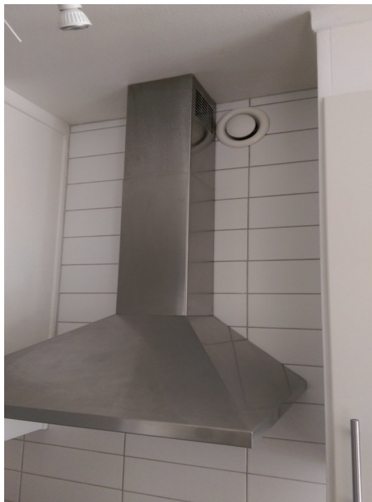
Figur 4 - Godkänd köksfläktinstallation med en kolfilterfläkt och en frånluftsventil (här en tallriksventil) som sitter fritt och inte är överbyggd av exempelvis skåp eller annat.