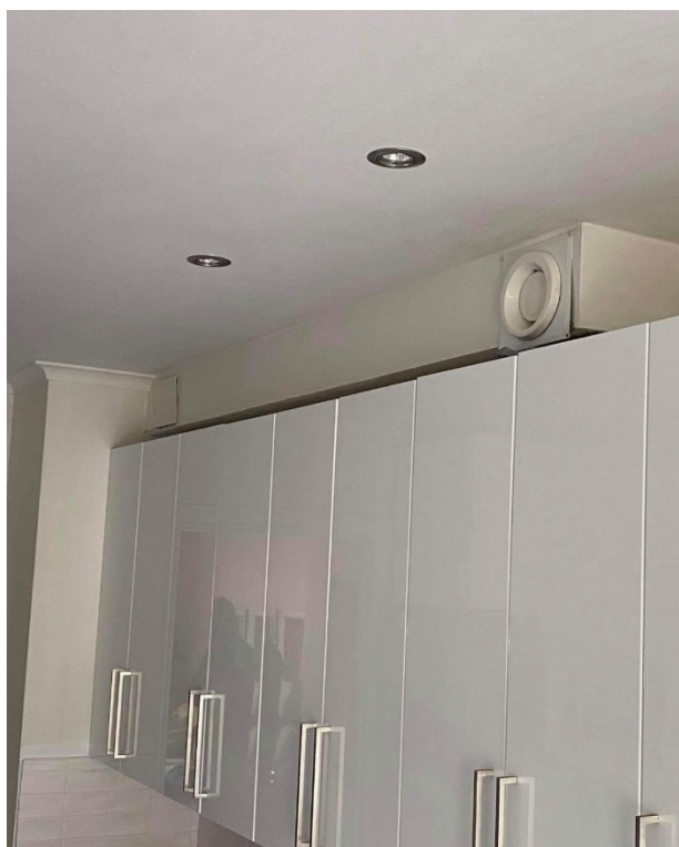
Figur 6 - Godkänd frånluftsventil som frilagts trots ditsatta köksskåp. Att ha byggt in ventilen bakom ett köksskåp eller inuti ett köksskåp är inte godkänt.