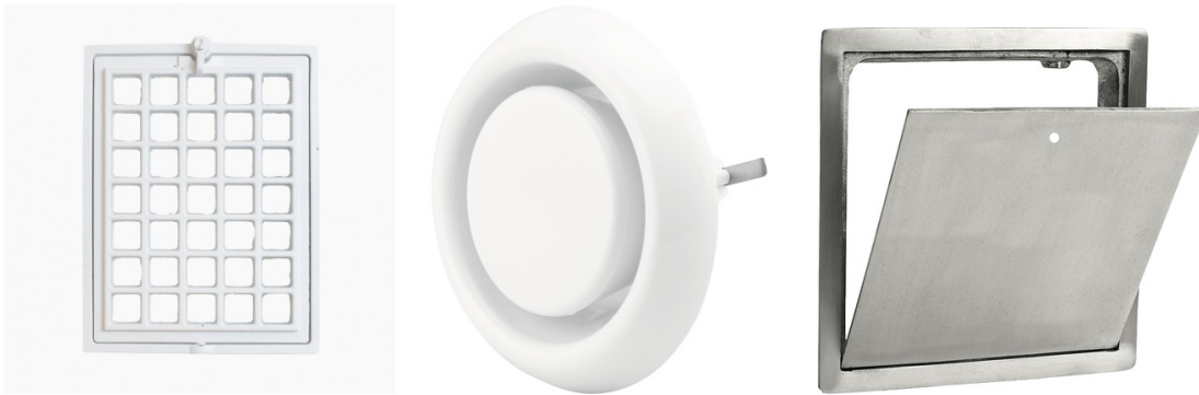
Figur 2 - Godkända frånluftventiler. Galler, tallriksventil och vippventil.