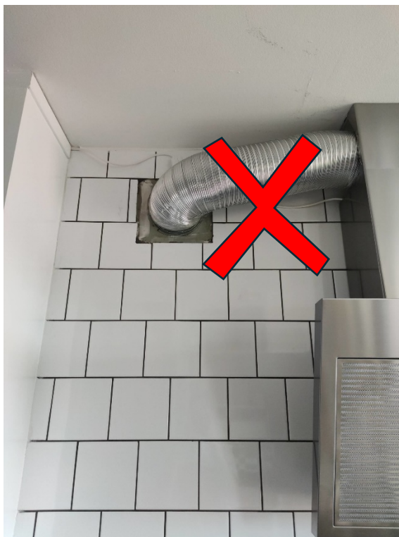
Figur 5 - Ej godkänd köksfläkt som kopplats till frånluftsventilen. För att få godkänt måste kanalen monteras bort och fläkten måste bytas ut till en med kolfilter, som rengör luften inuti fläkten istället för att trycka ut den rakt ut i skorstenen.