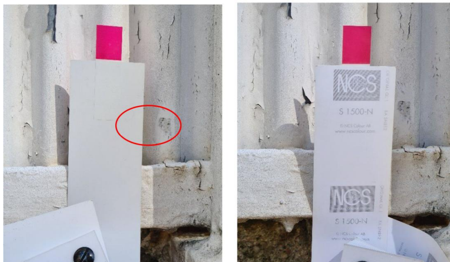
Den ursprungliga brutet vita kulör som mätts in. Samtliga, tidigare lätt gråvita balkongtom, har senare målats i renare vit kulör.

Nedan redovisas kulörinmätningen av den brutet vita som gjordes på plats. Den röda cirkeln ringar in den yta som kulören mätts in mot. Samma kulör mättes in på tillhörande smidesstommar.